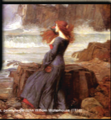
Illustration de la page de titre de Hamlet par John William Waterhouse (1911)